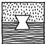
Tabelul nr . 6